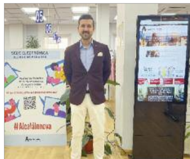
Para el concejal Innovación Tecnológica, era necesario adecuar la atención presencial ciudadana a la realidad del siglo XXI.

Es por ello por lo que se han incluido dos tótems digitales para que los vecinos y vecinas puedan obtener su cita previa directamente, incluso navegar a través de la web municipal. Por otra parte, para las personas mayores a partir de 65 años, se ha establecido un protocolo flexible de ayuda para que puedan ser atendidos directamente por personal municipal sin necesidad de solicitar cita previa.