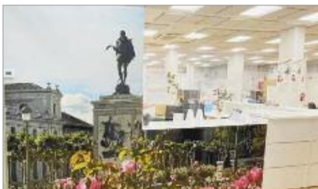
Esta Oficina atiende de media 200 personas al día, pudiéndose diferenciar los trámites más complejos de los más inmediatos