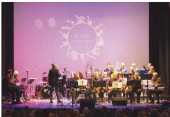
La Big Band ofreció un concierto dedicado a la canción en el Jazz