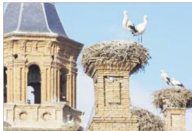
Se amplían el número de rutas disponible para observar las "Cigüeñas"