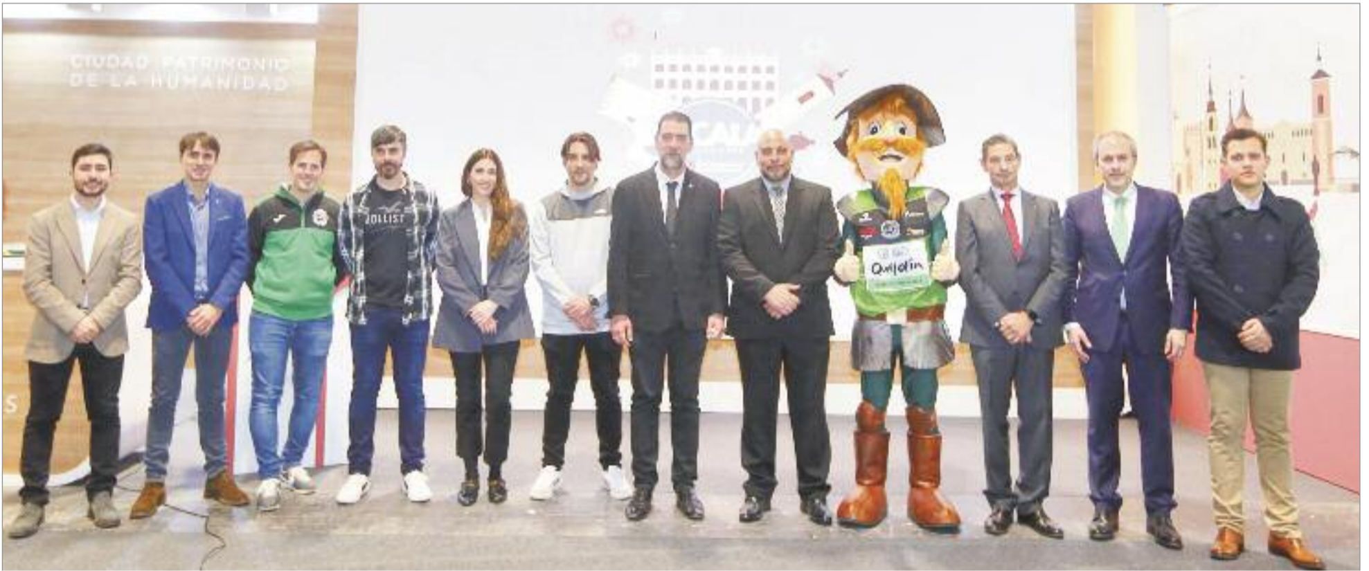
Las principales pruebas para el 2023 fueron presentadas en el stand de Alcalá de Henares por el teniente de alcalde y presidente de Ciudad Deportiva, la teniente de alcalde y concejala de Turismo, y el concejal de Deportes

Los amantes del Deporte tendrán una amplia selección de pruebas deportivas este nuevo año en la ciudad complutense: 10K Ciudad de Alcalá, Día del Atletismo Popular, Cross Aniversario Patrimonio Mundial, MADCUP 2023 y II Torneo Internacional Ciudad de Alcalá de Fútbol Sala