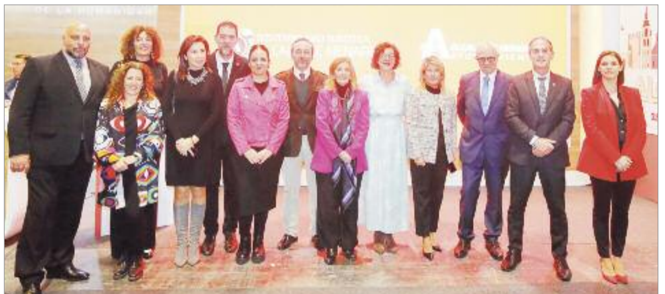
El Stand de Alcalá de Henares en FITUR 2023 fue el marco de la presentación del Plan de Sostenibilidad Turística por más de 10 millones de euros

Con este cuarto plan, el Ayuntamiento de Alcalá ha