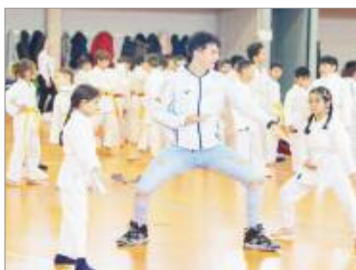
Las pequeñas demostraron un talento especial para el karate

El Complejo Deportivo de Espartales se convirtió en un gran tatami en el que más de 400 deportistas participaron en el Predeuko complutense. Una cita organizada por el Club de Karate Pablo Armenteros y el Club de Karate Paris Armenteros, que contó con la participación de cientos de jóvenes deportistas desde los 6 hasta los 15 años, en un total de 28 categorías. Todos los participantes contaron con la posibilidad de