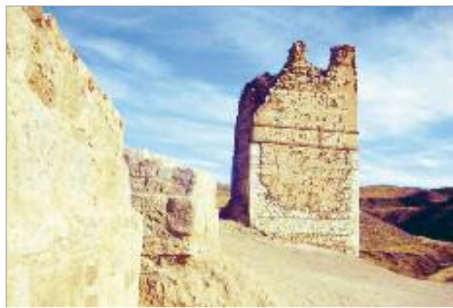
La programación comienza el 4 de febrero con la Ruta del Castillo Árabe

https://inscripciones.aytoalcaladehenares.es/actividades-de-educacion-ambiental-febrero-y-marzo/ . Se trata de actividades gratuitas y desarrolladas por educadores.