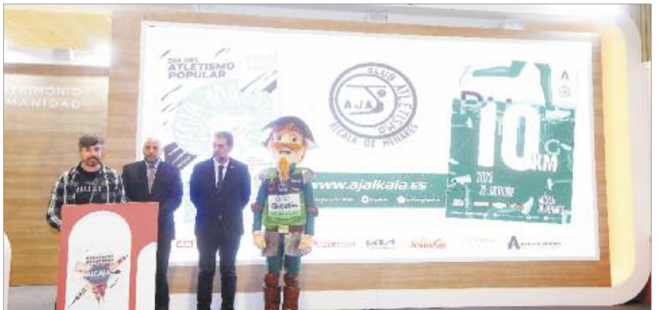
10K Ciudad de Alcalá aspira a convertirse en uno de los grandes referentes del calendario nacional del atletismo

MADCUP 2023 Por tercer año consecutivo, Alcalá de