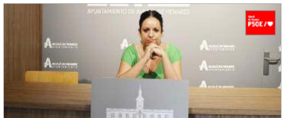
Los concejales y concejalas socialistas propusieron una moción conjunta con el Grupo Municipal Ciudadanos