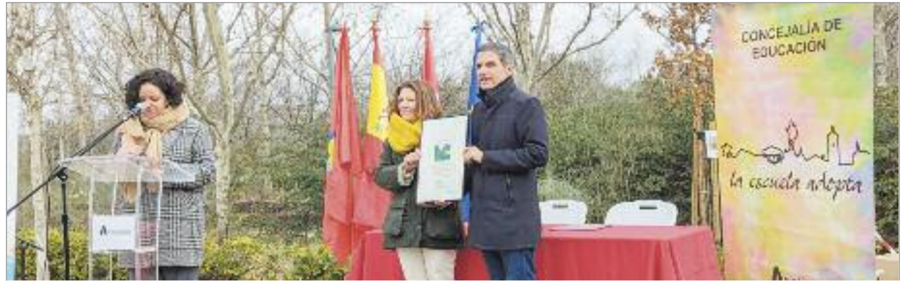
El alcalde felicitó al alumnado por su interés en conocer y valorar la ciudad, adoptando un espacio verde muy cercano a su Instituto

Con motivo del acto de adopción, que tuvo que ser suspendido hace varios meses, se plantó un árbol en dicho Pasillo Verde, que conmemorará para siempre la relación del espacio y el Instituto.