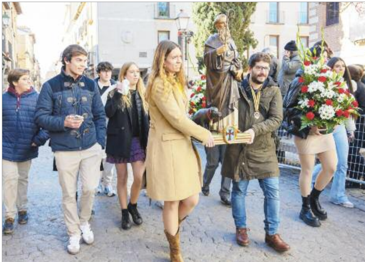
La tradicional Fiesta de San Antón, se celebró en la calle Mayor de Alcalá de Henares, a las puertas del Hospital de Antezana