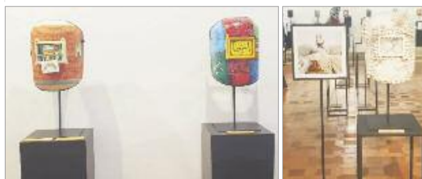
Se trata de una muestra basada en intervenciones y diversas técnicas aplicadas por varios artistas plásticos a caretas de soldar reutilizadas para ser convertidas en piezas artísticas.

Arturo Fernández, empresario afincado en Alcalá de Henares, consiguió unir a miles de personas y empresas con un único objetivo, llegando a recaudar más de 60.000 € que utilizó para comprar material y fabricar pantallas protectoras para los sanitarios y los cuerpos de seguridad del Estado. Se donaron más de 5.000 pantallas protectoras al Hospital Universitario Príncipe de Asturias y centros de salud de Alcalá de Henares, Hospital Universitario y centros de salud de Guadalajara, residencias de mayores, hospitales de Barcelona, así como a los sanitarios de toda España que las solicitaron. Se tuvieron que comprar miles de caretas de soldar debido a la escasez de materiales que había en ese momento y que se usaban para poner la sujeción de cabeza en las pantallas transparentes. Arturo decidió que esas caretas de soldar, en vez de tirarlas a la basura, podían ser reutilizadas, y fue así como se consiguió que artistas de toda España las intervinieran con diversas técnicas para esta exposición-homenaje.