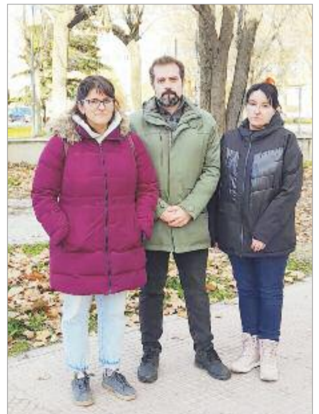
IU llegará a la Asamblea de Madrid y propondrá Declaración Institucional del Ayuntamiento de Alcalá de Henares por la falta de personal y medios en la residencia de mayores Francisco de Vitoria

"Cada día me paso a ver mi madre y la traigo un bocado y algo de fruta, desde hace unos meses me dice que se queda con hambre" – dijo el hijo de una residente. Este mismo recorte también es detectado en que ahora se adquiere material esencial de peor calidad, como los pañales. Por todo ello Izquierda Unida Alcalá de Henares envió escritos de queja al Defensor del Pueblo, a la Consejería de Familia, Juventud y Política Social, a la Agencia Madrileña de Atención Social, a la Dirección General de Atención al Mayor y la Dependencia, al Consejo Regional de Mayores y, es su intención, el llevar esta problemática a la Asamblea de Madrid y proponer una Declaración Institucional del Ayuntamiento de Alcalá de Henares para que se investiguen y se ponga remedio a las carencias que sufre la residencia de mayores Francisco de Vitoria.