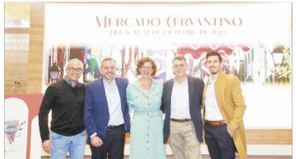
Se celebró el XXV Aniversario de la declaración de Alcalá de Henares como Ciudad Patrimonio de la Humanidad

Se trata de la cuarta convocatoria que obtiene el Ayuntamiento, lo que supone que se han concedido más de 10 millones de euros en solo tres años