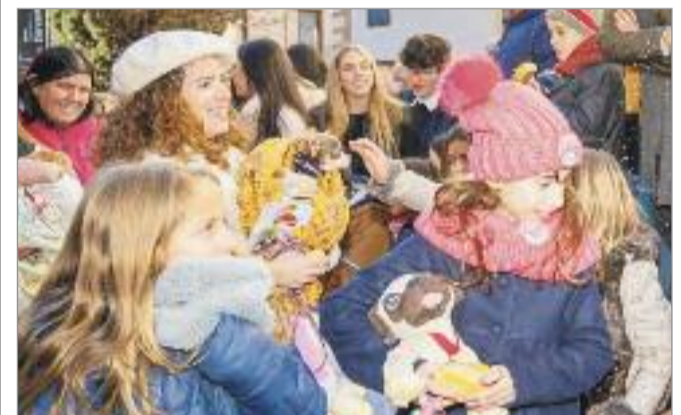
Las mascotas son un miembro más de las familias