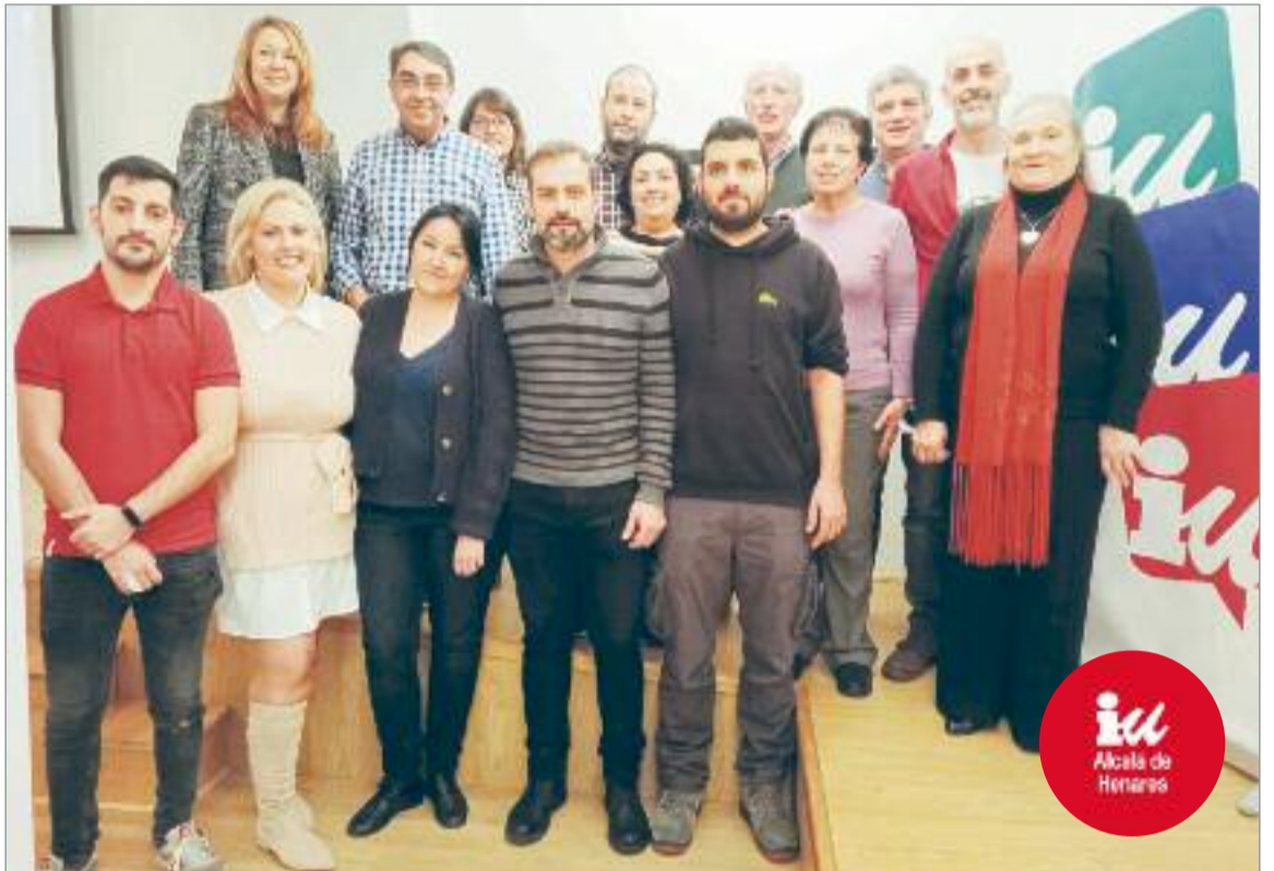
Al principio de la Asamblea se rindió homenaje a compañeros y compañeras de la organización que han fallecido en los últimos años.