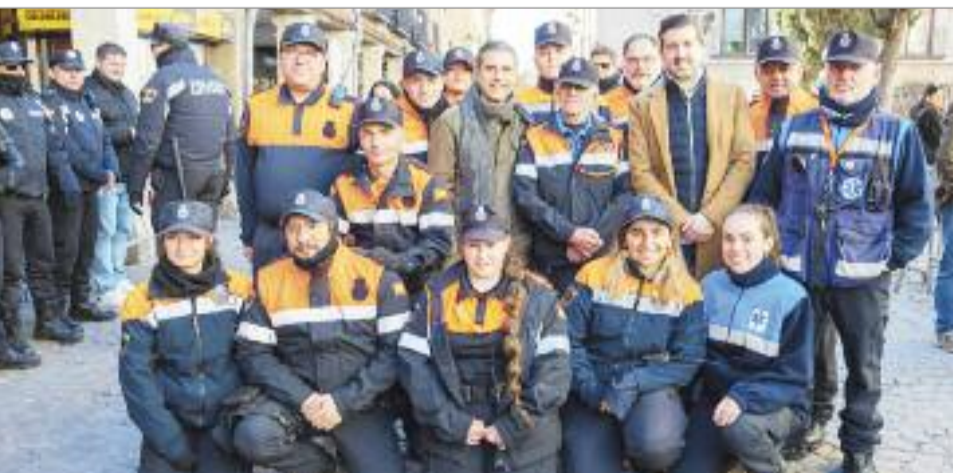
Como siempre, Protección Civil y las Fuerzas y Cuerpos del Estado, colaboraron en tan querido acto