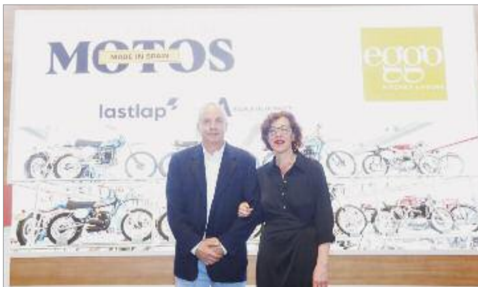
Alcalá es la sede de la gran exposición "Motos Made in Spain", que se puede disfrutar en la antigua fábrica de la GAL

Xtreme Challenge 2023: Se trata de un evento moto turístico, no competitivo ni deportivo, que da cita a la comunidad de motoristas y a las marcas referentes del sector. El primer día se celebrarán diversas actividades en el Paseo de Aguadores, como exposición, presentación de modelos, jornada de prueba de motos y briefing de la ruta. El segundo día, los participantes podrán disfrutar de un recorrido secreto