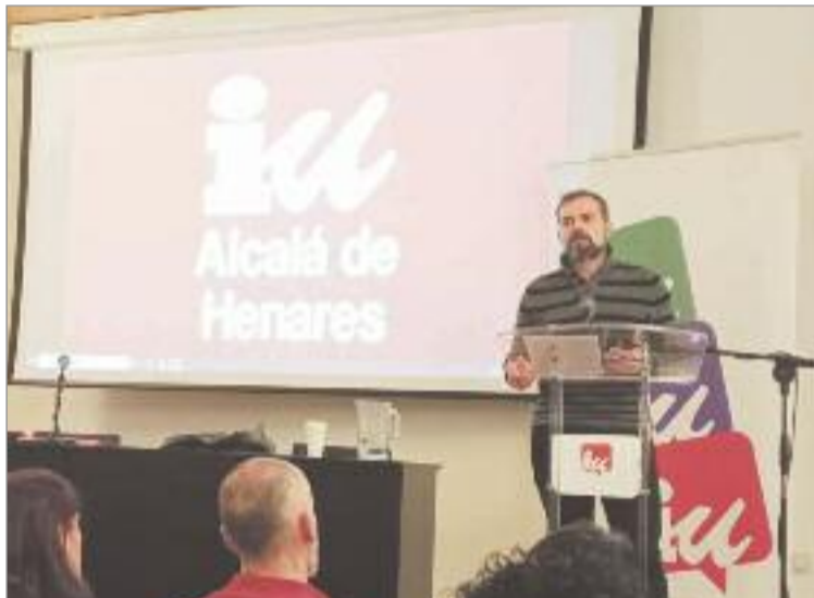
Su intención es que esta lista confluya con otras fuerzas de izquierdas de la ciudad

IU ha realizado la elección de su candidatura a las elecciones municipales en Alcalá de Henares. Su intención es que esta lista confluya con otras fuerzas de izquierdas de la ciudad, conformando una única candidatura municipal que aglutine a la izquierda transformadora de Alcalá de Henares. Al principio de la Asamblea se rindió homenaje a compañeros y compañeras de la organización que han fallecido en los últimos años.