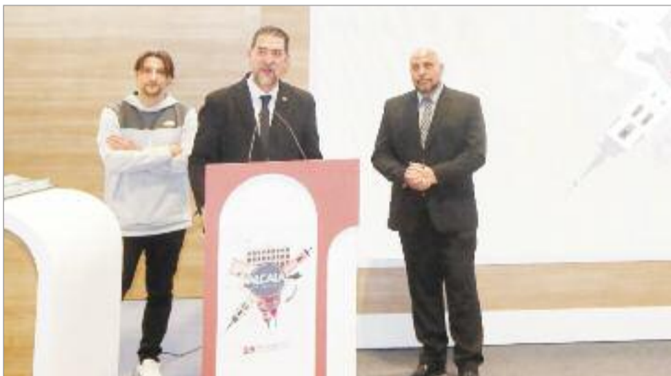
Alcalá posicionó en FITUR 2023, el inmenso potencial deportivo, económico y turístico de sus pruebas deportivas.