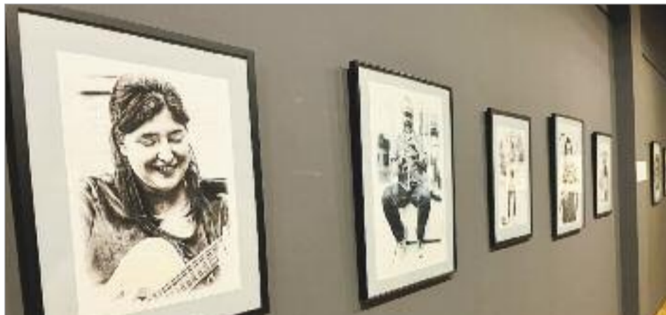
"Ciudadanos en la calle" muestra el trabajo más personal del artista Arturo Bodelón

El autor ha usado el blanco y negro al editar las fotografías, lo ha matizado para realzar los contrastes en cada persona, lo que confiere a la exposición una autenticidad singular. En los mendigos ha hecho hincapié en el contraste, para remarcar el carácter extremo de vivir y dormir en la calle. En los músicos aparece