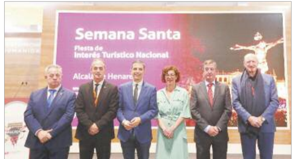
El alcalde, el vicealcalde, y la teniente de alcalde y concejala de Cultura y Turismo, asistieron a la apertura del stand

El Stan de Alcalá en FITUR tuvo una gran acogida tanto para profesionales así como para el gran público Turístico que atesora la ciudad. La Semana Santa, las representaciones al aire libre y multitudinarias del Don Juan en Alcalá y la Semana Cervantina, son los grandes baluartes turísticos de Alcalá y así se demostró en FITUR. Aunque se trató de tres citas muy diferentes en su planteamiento, todas compartieron la gran acogida del público y su interés cultural.