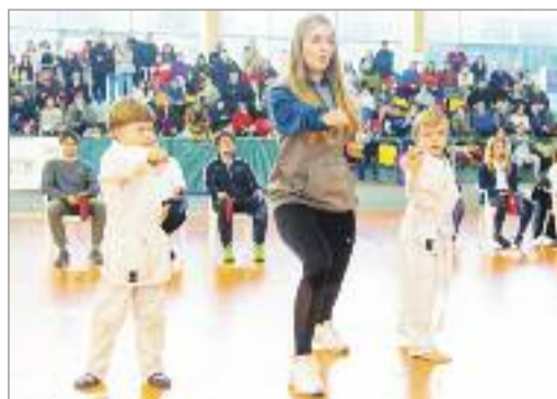
Participación cientos de jóvenes deportistas desde los 6 hasta los 15 años, en un total de 28 categorías.