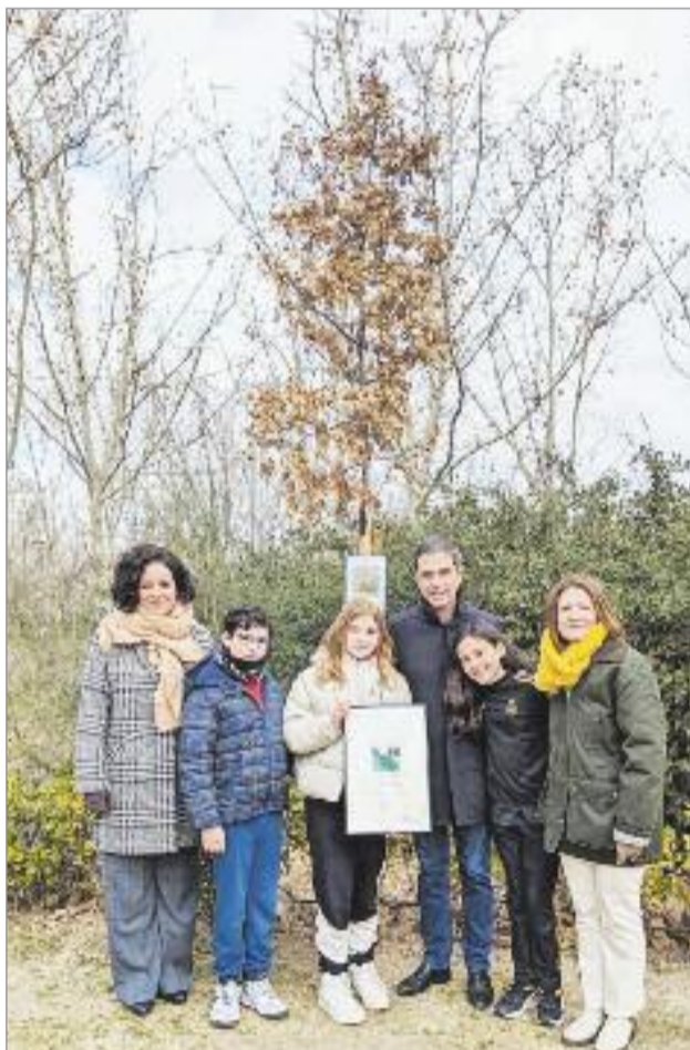
El IES Francisca de Pedraza es el primer IES que se sumó a este programa

El programa “La Escuela Adopta” se puso en marcha el curso escolar 2017-2018 y fomenta que los colegios de Alcalá de Henares adopten simbólicamente un edificio patrimonial o espacio de la ciudad, realizando