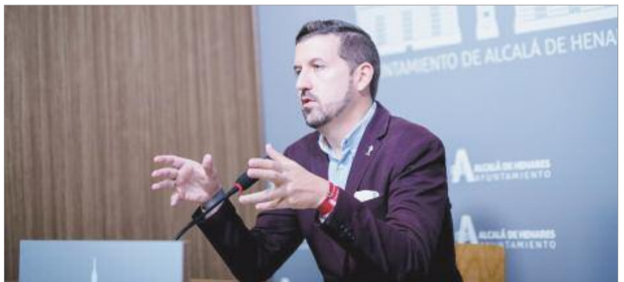
Para el concejal de Transparencia, Innovación Tecnológica y Gobierno Abierto, es una muy buena noticia que la red AlcaláWiFi tuviera tan buena acogida

Fue una de las 10 acciones que englobaba el Plan y se ha adjudicó por 297.490,61€, integrada dentro del componente 14 del Plan de Recuperación, Transformación y Resiliencia, el cual recoge el objetivo de transformar y modernizar el sector turístico aumentando la digitalización.