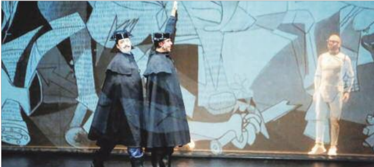
El Centro Cultural Gilitos arrancó su programación cultural de 2023 con la divertida obra “La mejor obra de la historia” de Spasmo Teatro

componente didáctico. “La mejor obra de la historia”, exenta de palabras, estuvo cargada de humor gestual y dinamismo, con un formato digital que recuerda a las aplicaciones móviles, destinado a los más pequeños. Mayores y niños pudieron conocer de una manera muy amena obras que se encuentran en los museos más importantes del mundo sin levantarse de la butaca.