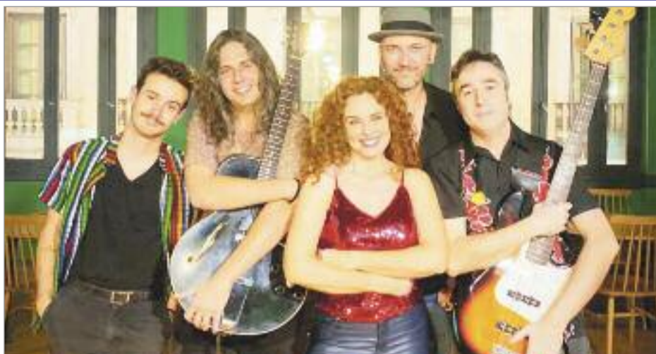
Silvia Marsó llegó a hacer su debut musical en el Teatro Salón Cervantes de Alcalá de Henares

La popular actriz Silvia Marsó llegó al Teatro Salón Cervantes para ofrecer al público su faceta musical junto a Del Toro Blues Band. "Blues&Roots" es un recorrido por el alma de la música negra que tanto atrajo a intelectuales y artistas de todo el mundo, entre ellos Federico García Lorca, muy presente en este espectáculo musical del que Marsó es directora, dramaturga, compositora y cantante. La artista catalana se ha embarcado en este apasionante proyecto que recorre de forma vibrante y emocional desde el nacimiento del blues a orillas del Mississippi hasta su gran explosión en Manhattan, y que aúna música, teatro, poesía, historia y mucha pasión.